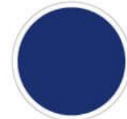
Xanh Dương TT