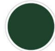
Xanh Rêu TT