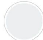
Trắng Sữa TT