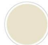
Vàng Kem TT